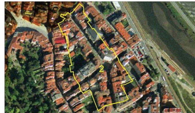
UBICACIÓN DE LA PARCELA EN EL PLANO CATASTRAL