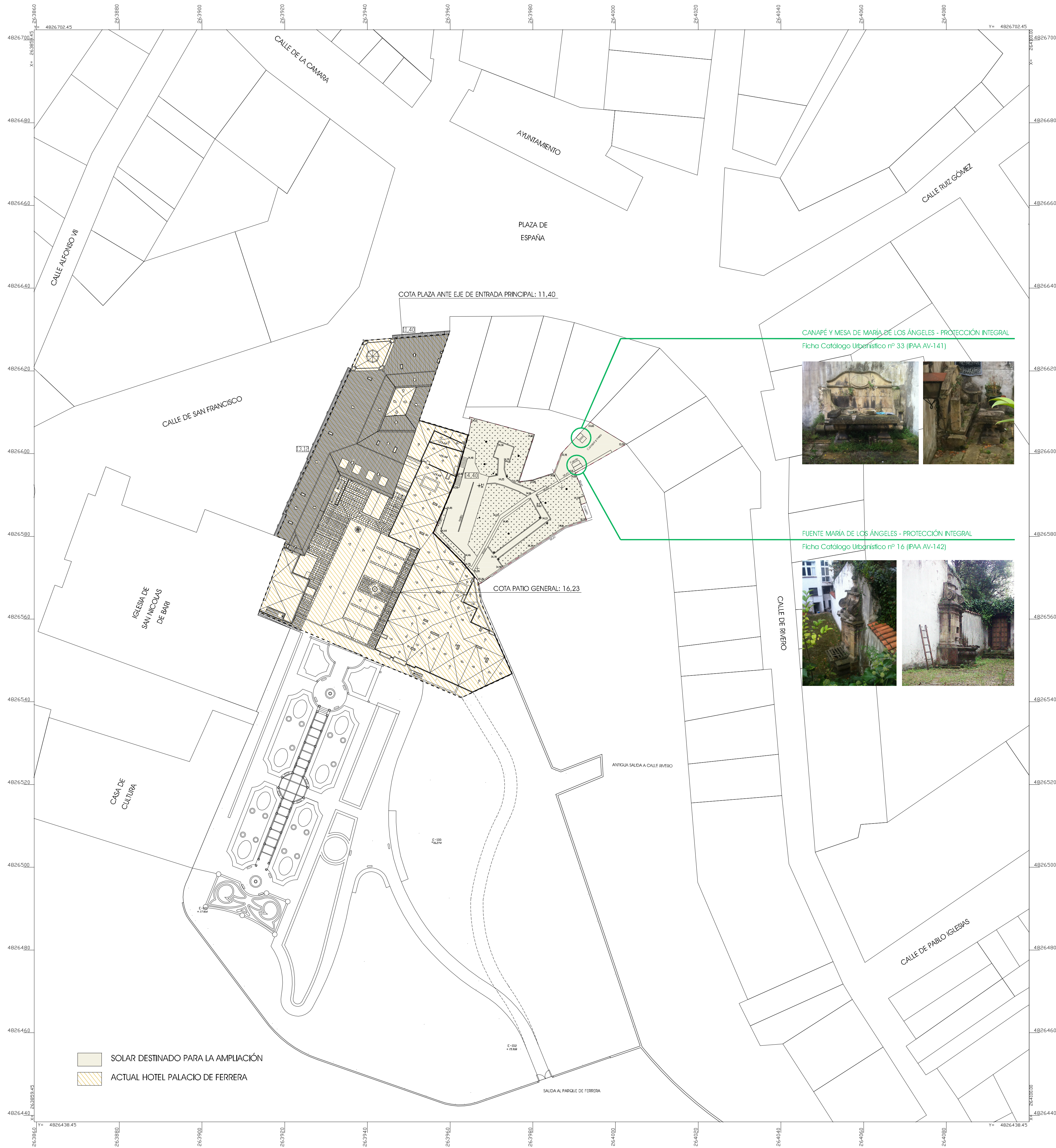
EMPLAZAMIENTO, ACTUAL HOTEL PALACIO DE FERRERA Y ZONA DE AMPLIACIÓN 1:500